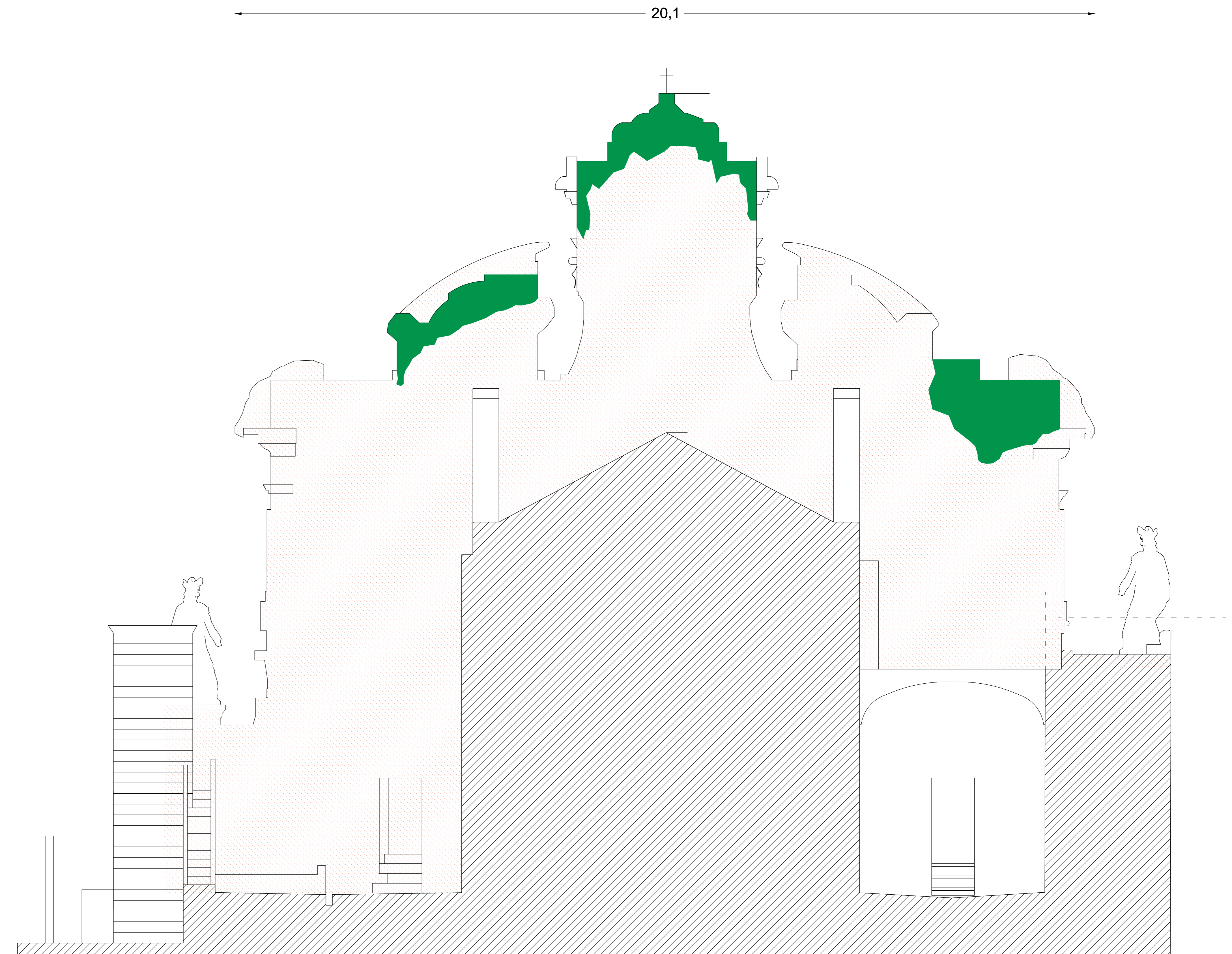
PROSPETTO POSTERIORE (CONTROFACCIATA) - 1:500